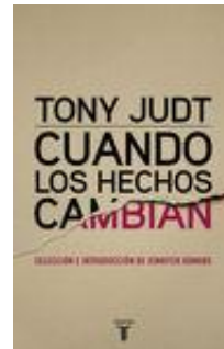
CUANDO LOS HECHOS CAMBIAN Tony Judt

Con el título Cuando los hechos cambian se recogen una selección de ensayos sobre temas culturales y políticos publicados en los Estados Unidos e... Leer más