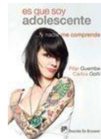
ES QUE SOY ADOLESCENTE... Y NADIE ME COMPRENDE