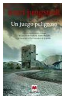
UN JUEGO PELIGROSO Mari Jungstedt

Un juego peligroso es el octavo thriller de Mari Jungstedt que, como en anteriores ocasiones, sitúa la acción en la isla báltica de Gotland, en e... Leer más