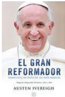
EI GRAN REFORMADOR Austen Ivereigh

Biografía sobre el Papa Francisco excelentemente documentada y ambientada que muestra detalles inéditos hasta el momento sobre la trayectoria de ... Leer más